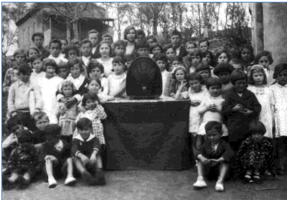
Fotografía del radio en medio de alumnos de las dos escuelas de Villavaler (1933)

El día de la función, mi madre y sus hermanos se divertían mucho y les satisfacía el ver cómo aquello les gustaba a los espectadores que eran la casi mayoría de la corta población de la comarca. Muchas veces, el «acontecimiento» terminaba con merienda que los propios asistentes y mis padres preparaban para el final.