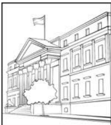
EL GOBIERNO FANTASMA

Centropablonoticias reproduce este artículo publicado en el blog La joven Cuba para contribuir a la difusión de preocupaciones que compartimos y que nos atañen. Aunque se refiera a un hecho situado en una provincia del país, sus preguntas y planteamientos pueden ser de utilidad –de necesidad– en otras regiones.